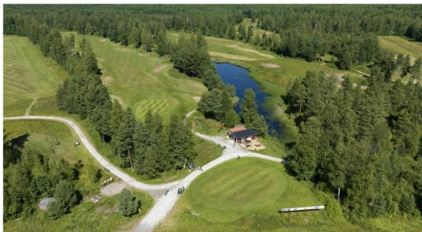
Solöns Golfklubb växer, nu med en äventyrsbana som komplement till de befintliga nio hålen.